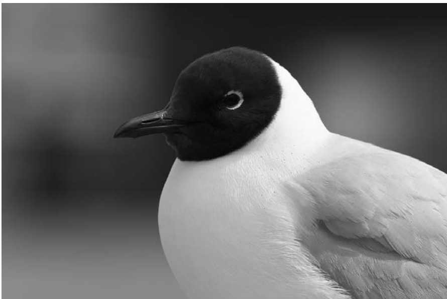
Naurulokki ( Larus ridibundus ). Common black-headed gull.

Käsitys lintupopulaatioiden runsaudesta alkoi karttua runsaudenlaskentamenetelmien kehittyessä osana vankkaa suomalaista lintutiedettä. Pesivän maallinnuston linjalaskennat avasivat kvantitatiivisen lintututkimuksen, mutta pian myös vesi- ja rantalinnuston määriä ilmoitettiin pesivinä pareina. Samoihin aikoihin 1930-luvun alussa aloittelivat järvilinnustotutkimuksiin sekä Pontus Palmgren Ahvenanmaalla että Antti Reinikainen Savossa. Saimme dokumentteja kosteikkoyhteisöjen muodostumisesta ja vaikkapa naurulokin, punasotkan, silkkiuikun ja nokikanan levittäytymisestä ja runsastumisesta. Esitettä-