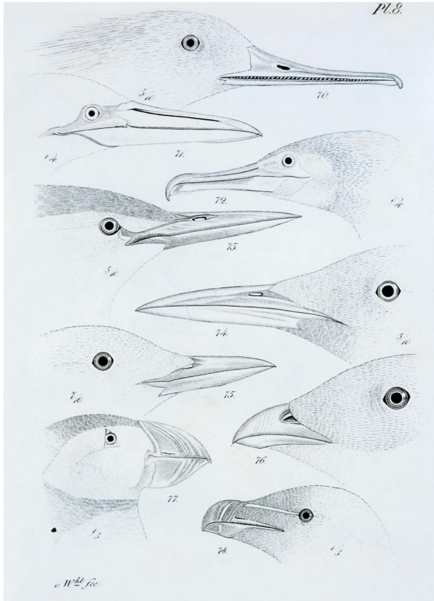
Kalansyöjälintujen nokka-galleriaa. Lajit: tukkakoskelo, suula, merimetso, silkkiuikku, kuikka, riskilä, pikkuruokki, lunni ja ruokki.