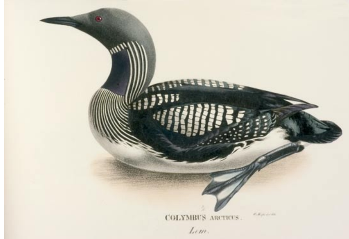
Kuikka. Wilhelm von Wright, teoksesta "Svenska Foglar", 1828.