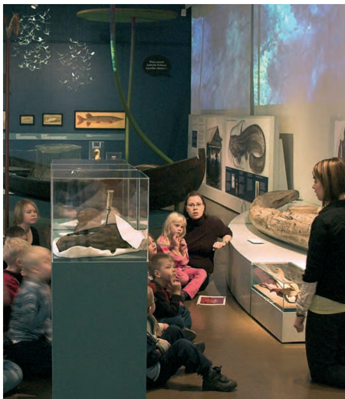
”Ajan tietäjiä – ilmoja ja ilmiöitä”. Kuopion museon 100-vuotisnäyttelystä.

Eikö kaikki museotyö, mitä edellä on kuvattu – ja erityisesti tornihuoneen istuntojen ilmiöpohjainen pohdinta – ole ollut elämänkeskuksen lähestymistä, ymmärtämisyritystä, pyrkimystä katsoa todellisuutta myös elämänkeskuksen näkökulmasta.